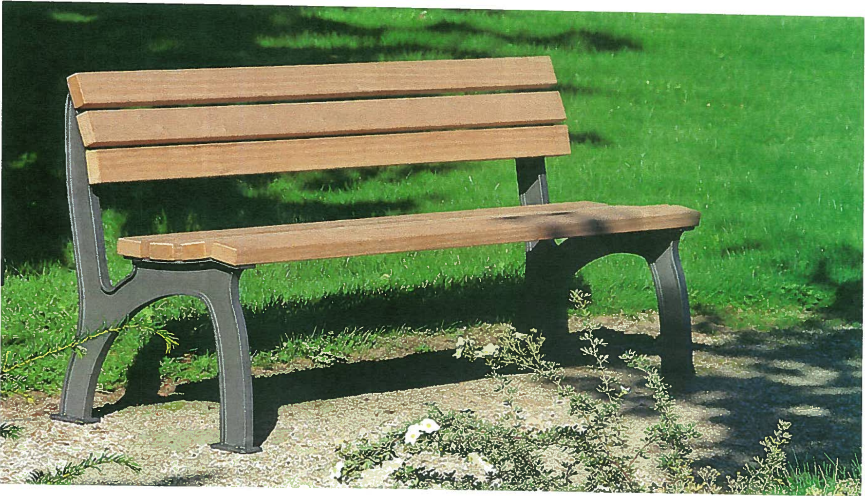
Anlage 2, Bankstandard im Innenbereich, „Bitburg“ von Westfelferwerke