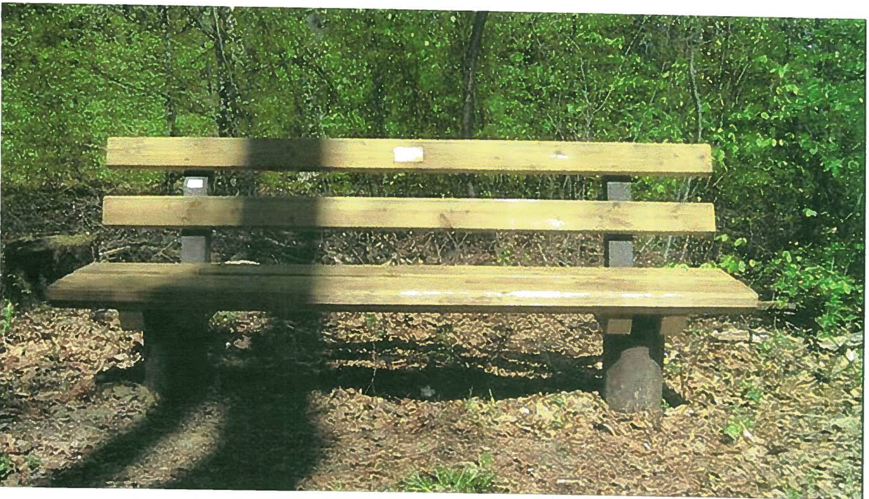
Anlage 3, Bankstandard im Außenbereich, „Waldbank“ vom Hersteller Koch